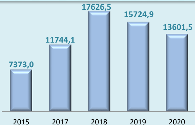
Обсяг капітальних інвестицій, млн.грн

У 2020 році зберігається тенденція до зменшення обсягу капітальних інвестицій в порівнянні з попереднім роком