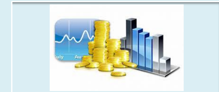
Обсяг капітальних інвестицій на одну особу населення, грн

У 2020 році зберігається тенденція до зменшення обсягу капітальних інвестицій в порівнянні з попереднім роком