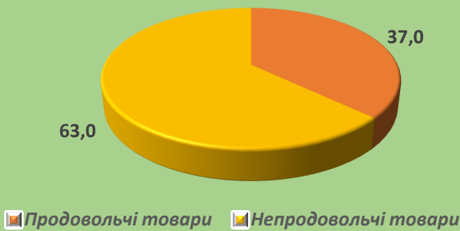
Товарна структура роздрібного товарообороту підприємств у 2019 році %